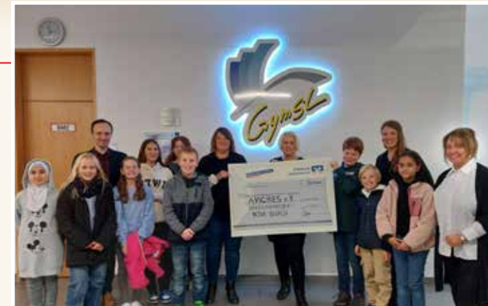
Vertreter der Schule und des Vereins der Förderer des Hilfsprojektes Nova Iguaçu e.V. mit dem Scheck für die Avicres